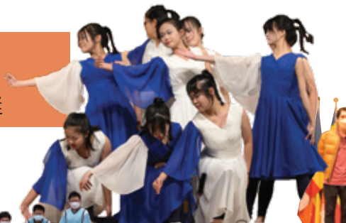
第59屆學校舞蹈節 佛梁舞蹈隊 當代舞（中學組）甲級獎