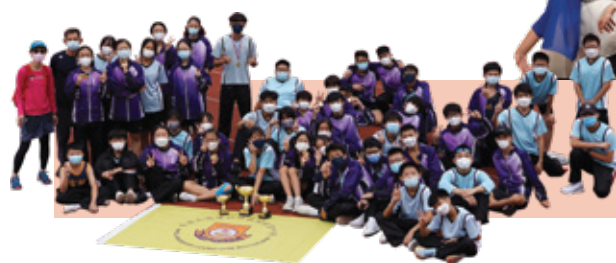
屯門區中學校際田徑比賽 佛梁田徑隊 2冠、3亞、4季