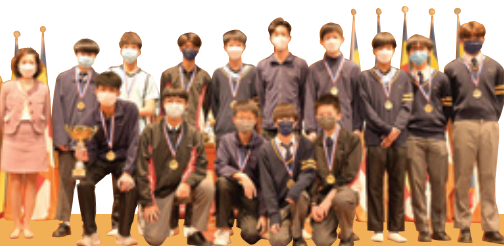
2022-2023 學校體育推廣計劃 外展訓練計劃 5人足球比賽（上學期） 男子中學組 冠軍