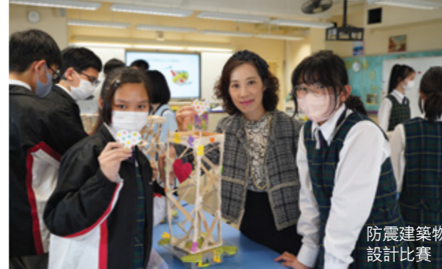
防震建築物設計比賽