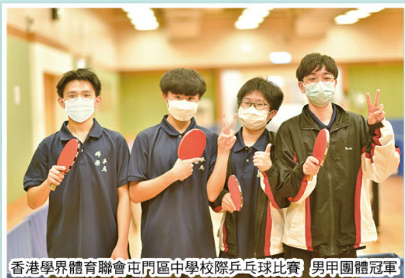
香港學界體育聯會屯門區中學校際乒乓球比賽 男甲團體冠軍