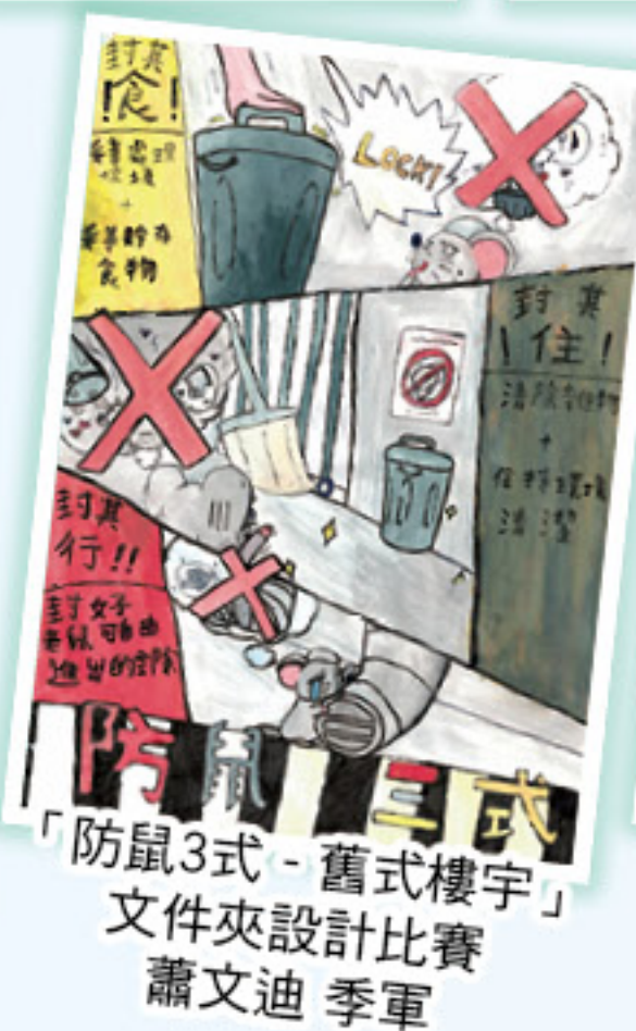
「防鼠3式 - 舊式樓宇」文件夾設計比賽 蕭文迪 季軍