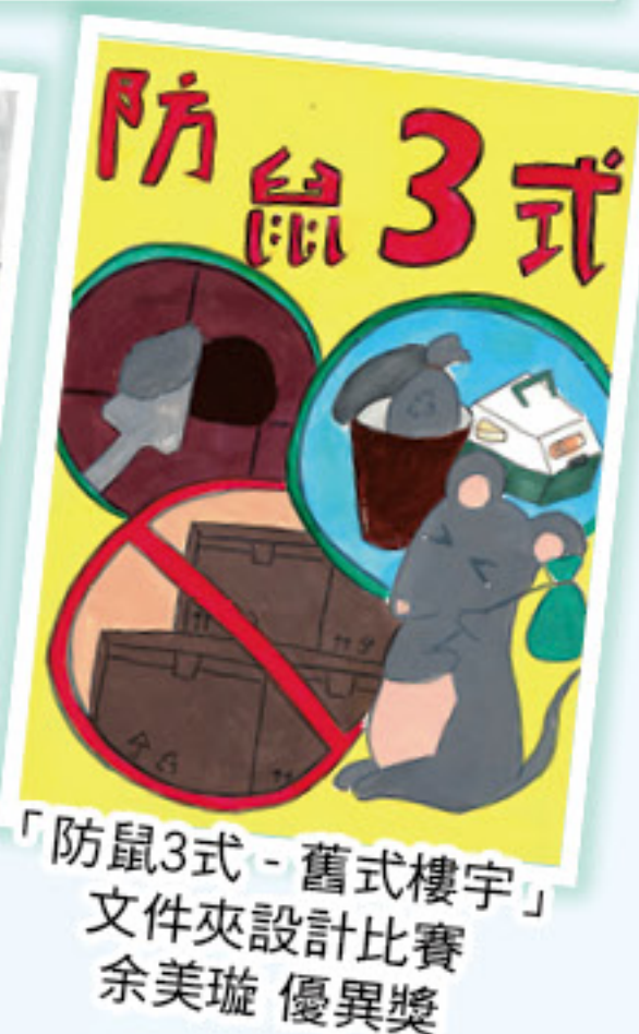
「防鼠3式 - 舊式樓宇」文件夾設計比賽 余美璇 優異獎