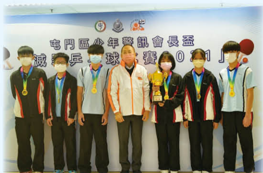
「滅罪乒乓球邀請賽2021」團體冠軍