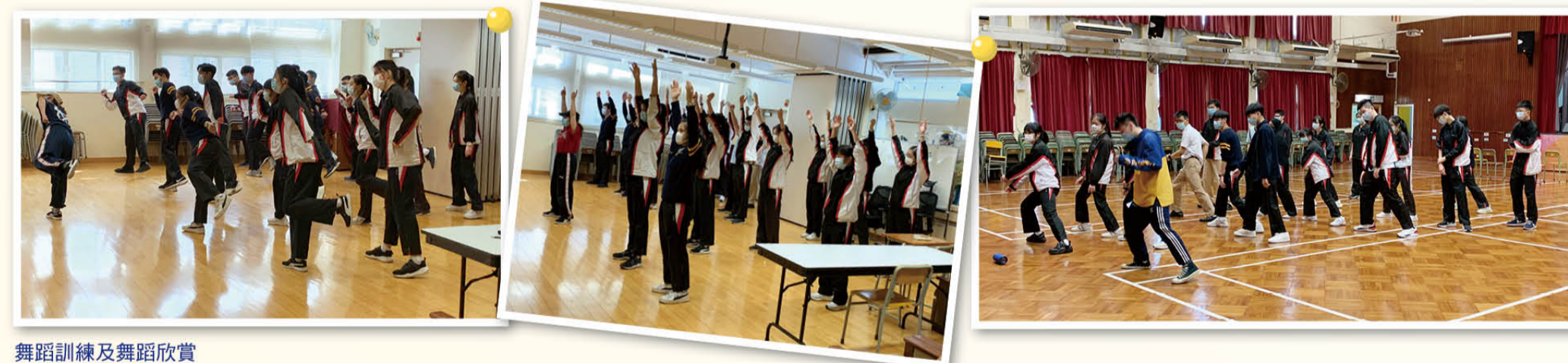
舞蹈訓練及舞蹈欣賞