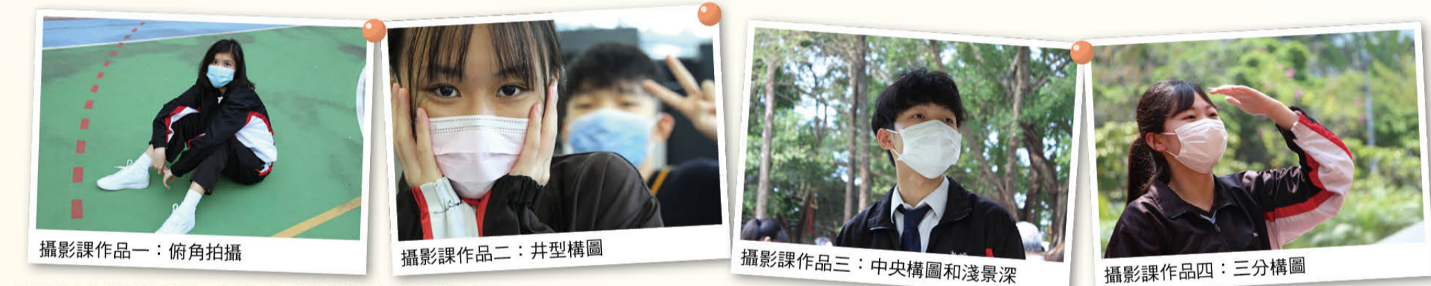
中五級人像攝影技巧課，介紹不同的攝影技巧，學以致用。