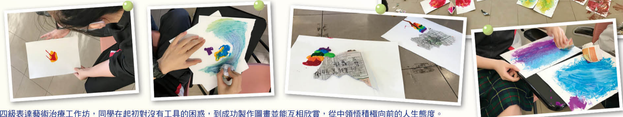
中四級表達藝術治療工作坊，同學在起初對沒有工具的困惑，到成功製作圖畫並能互相欣賞，從中領悟積極向前的人生態度。