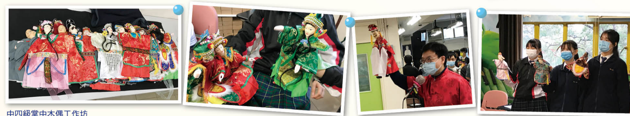
中四級掌中木偶工作坊