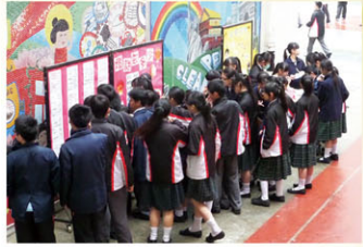
中文周攤位人頭湧湧