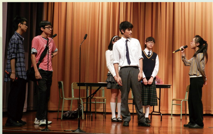
除了讀書，匡同學還參與了戲劇隊的演出