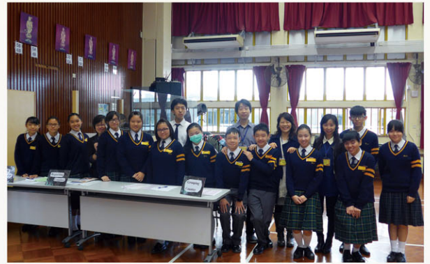
English Ambassadors helped in school functions