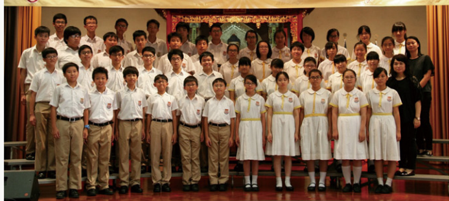
生動活潑 笑容滿臉

HHCKLA BUDDHIST LEUNG CHIK WAI COLLEGE English Interview Practice for Primary 6 Stud