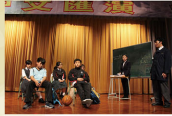
戲劇隊於中文匯演落力演出話劇，七情上面