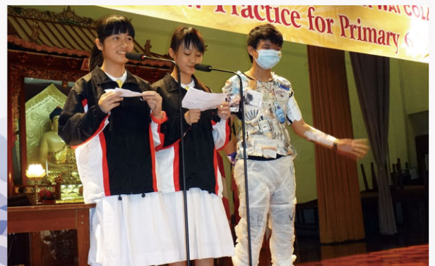
Students introducing their environmental fashion design