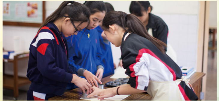
Making delicious cup-cakes