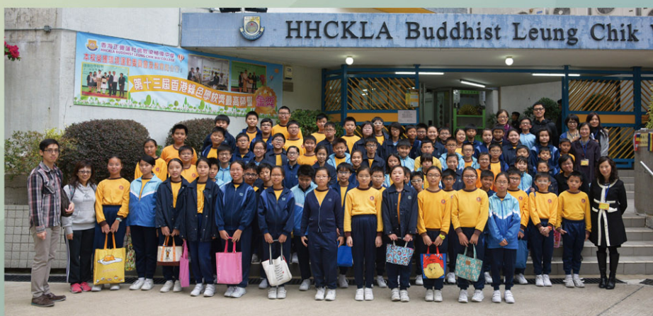
Cheers & smiles