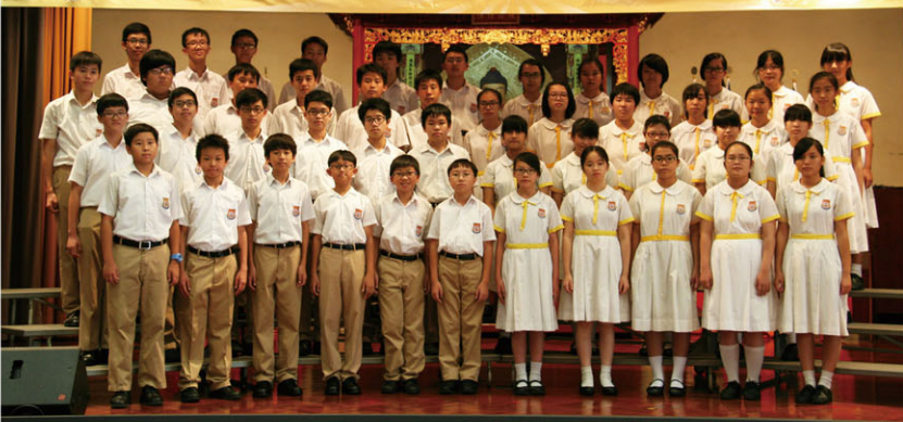
Students performing the poem on stage