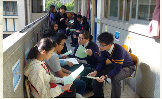
English Ambassadors practising interview skills with primary school students

Through a wide range of extra-curricular activities, students have valuable chances to build confidence in using English outside classroom. Our students participated in interschool competitions and activities. In 67th Hong Kong Schools Speech Festival, our students had excellent results in both the solo verse and choral speaking sections. Our English Debate Team also actively participates in interschool matches. Besides, it is our school's mission to build a language rich environment on our campus. Our English Ambassadors serve in different posts such as MCs and student helpers in various school functions. To master English does not equal to mastering examination skills. We provide our students with chances to use English in their daily life.