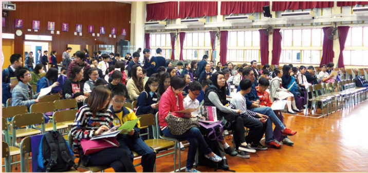
Both parents & primary students are reading school information carefully

Our hope is that all participants of our activities can learn to become responsible and happy secondary school learners in the years to come.