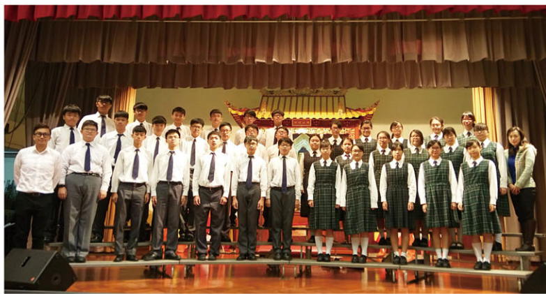
中四級詩文集誦季軍4A班

課堂教學只是語文學習的一部分，課堂以外的活動也是精彩的學習經歷。我們積極舉辦多元化的學習活動，多角度培養學生的語文素質，例如卓越司儀訓練計劃、故事演講比賽、辯論隊、創作集、朗誦隊、中文匯演等。這些活動兼備讀、寫、聽、說等元素，不同能力的學生都能從中盡情學習，發揮所長，實踐「活學中文」的精神。