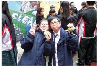
同學們玩得很高興呢！

中國語文科被外界視為文憑試的「死亡之卷」，是可笑，更是可悲。如果同學在六年的中學生涯只懂生吞活剝，那麼六年後便惟有「含淚應考」，最終「戰死沙場」。其實語文就是生活，語文素材在生活中俯拾即是，由古今名家的文學鉅著，到校園同窗的生活小品都可以是語文教學的素材。多年來，我們以「能力為經，生活為緯」的理念設計校本課程，透過古今中外的作品，或探討人性，或反思人生，或探究社會，或遊走古今，引領同學深入探索遼闊的文字世界。