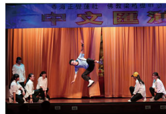
同學們在中文匯演載歌載舞