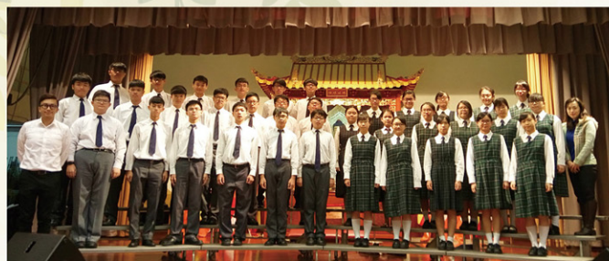
意識投入 眼神集中