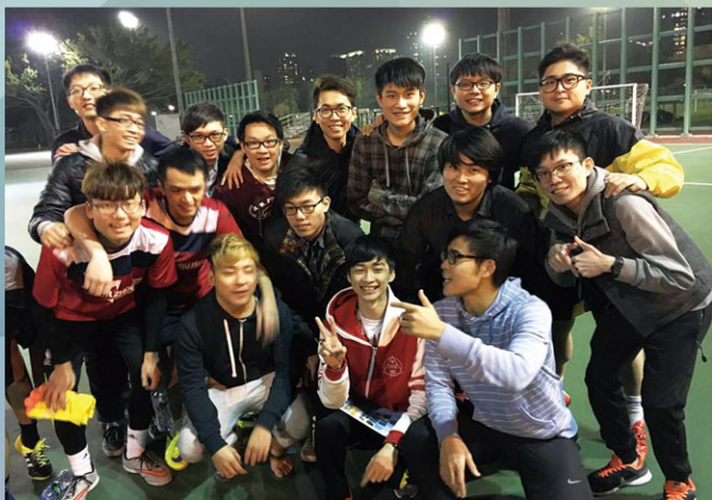
匡同學的大學生活