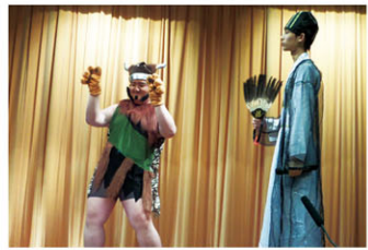
還有孟獲和諸葛亮