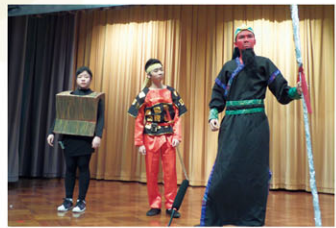
不單時裝，還有古裝，關公出場