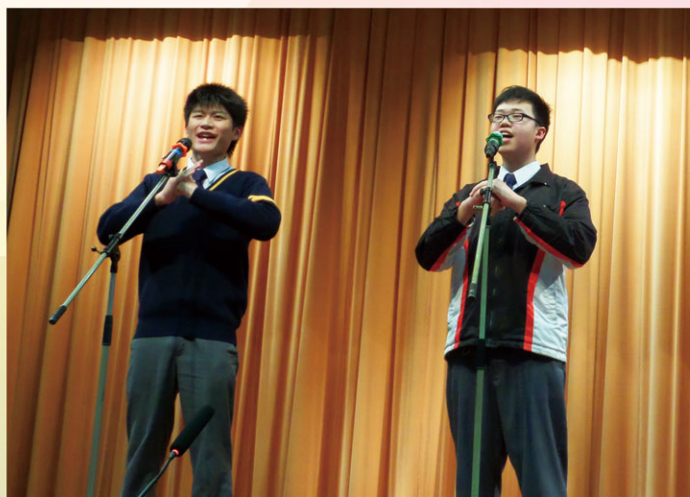
普通話相聲，大家看過沒有？