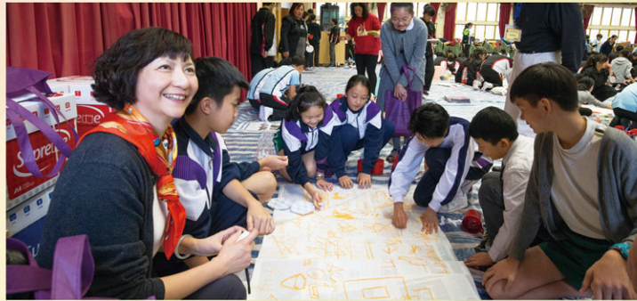
Let's create our own work together