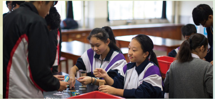
Having fun in the laboratory