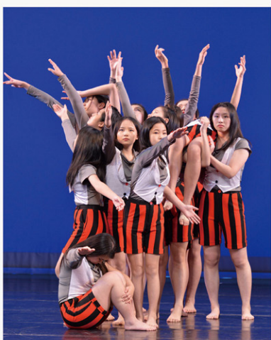
現代舞Alone in the Group