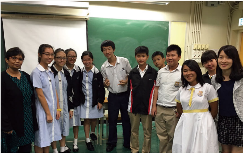
The Debate Team participated in a friendly match