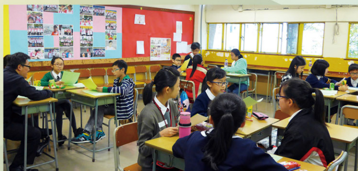
Discussion is easy and interesting