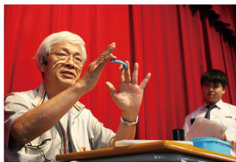
麵塑師傅向同學即場示範製作麵塑