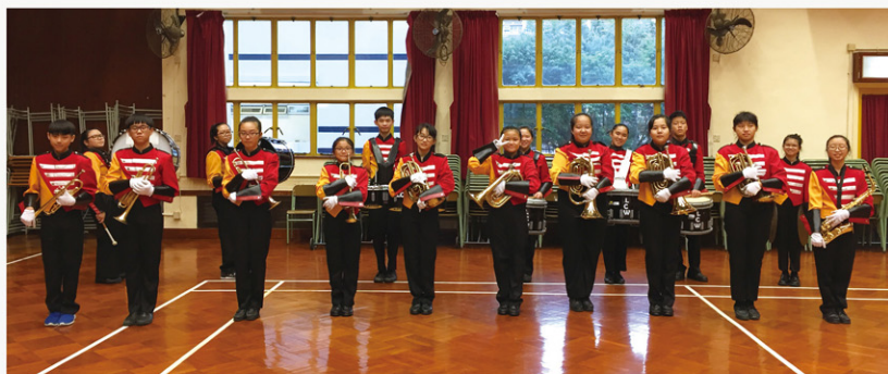
參與「香港步操樂團比賽」及「鼓樂對戰」