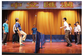
師生踢毬比賽，老師與同學切磋競技