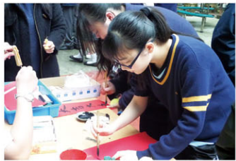
同學們專注地寫揮春