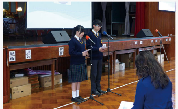
English Ambassadors served as MCs in workshops for primary six students