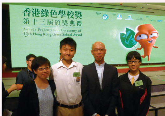
黃錦星局長親身頒獎